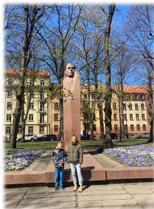
Kristijonas Donelaitis