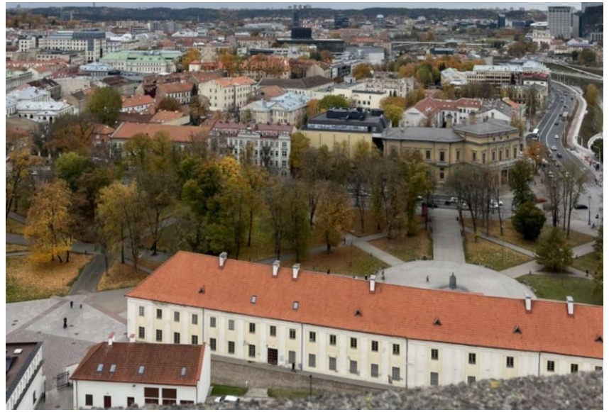
Vaiva Saulėnaitė, 8b kl.